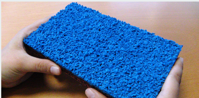
El nou paviment, de 15 mm de gruix, afavorirà els entrenaments

per un nou tipus de terra de Nivell 1 homologat per la IAAF. D'aquesta manera, els usuaris podran gaudir d'un paviment in-