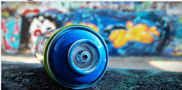
L'art del grafiti immortalitza sobre parets impactants creacions artístiques

Els grafiters que vulguin deixar per sempre una creació pròpia a La Mar Bella poden participar enviant la seva idea a l'adreça electrònica que s'ha habilitat específicament per aquest concurs: graffiti@elconsell.cat . Disposen fins al dilluns, 8 de maig,